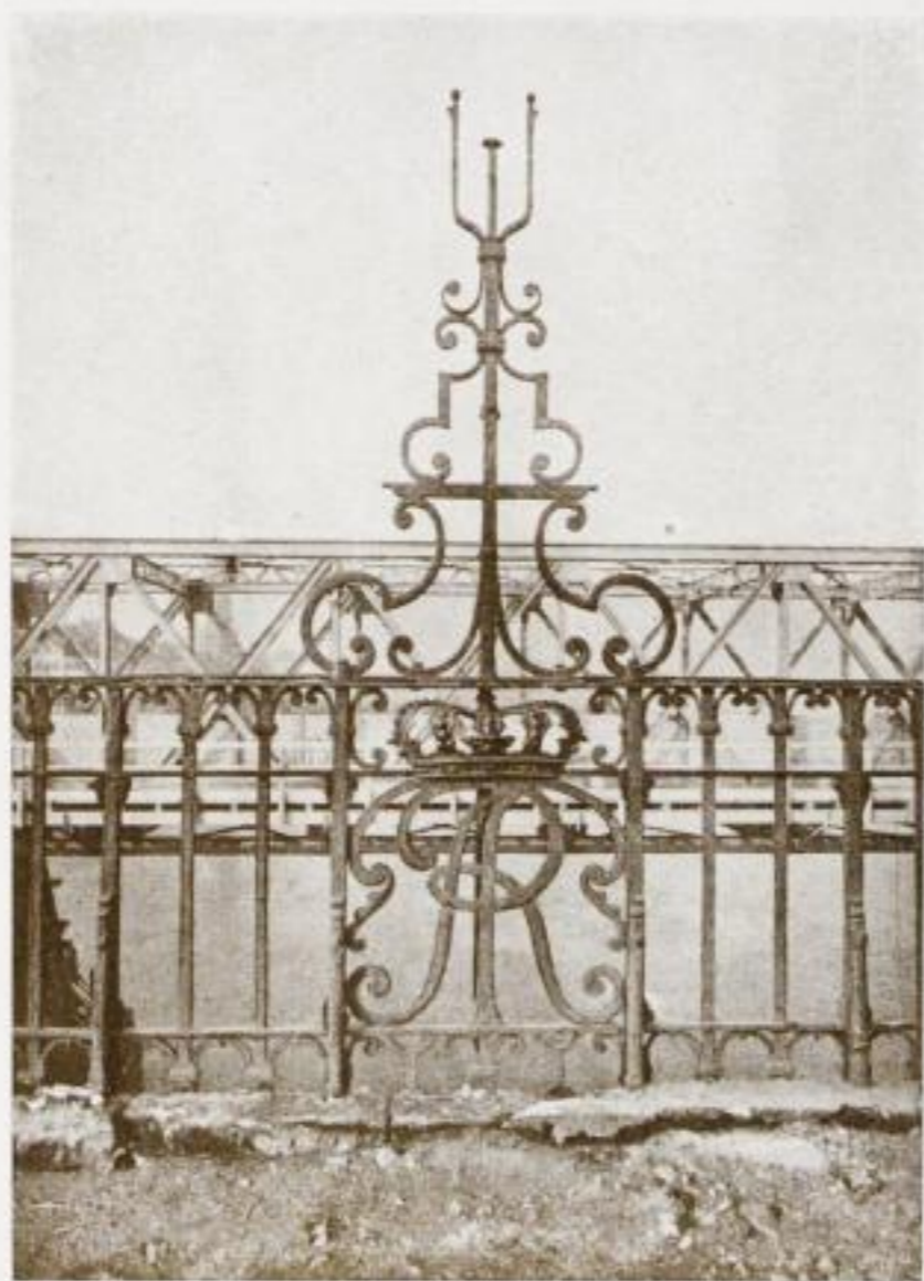
55. Schmiedeeisernes Brückengeländer.