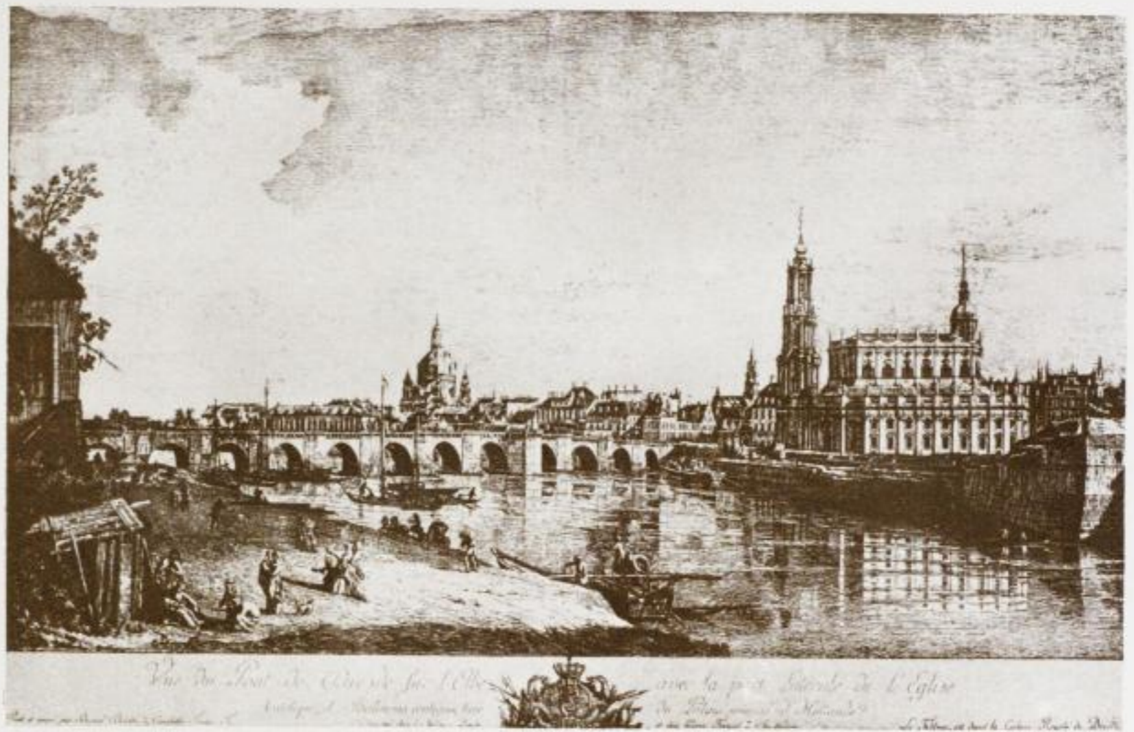
63. Dresden um die Mitte des 18. Jahrhunderts. (Radierung von Canaletto.)