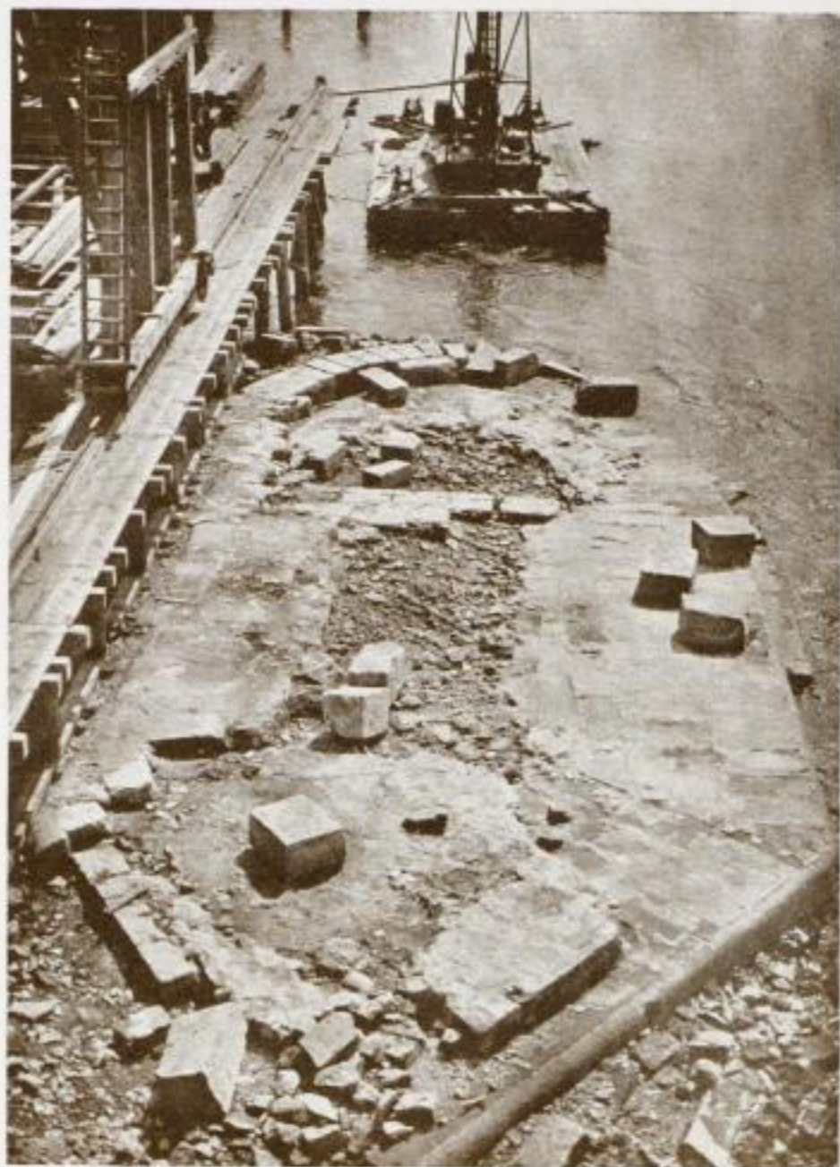
79. Erste Steinschicht des Pfeilers 15 über dem Koff.