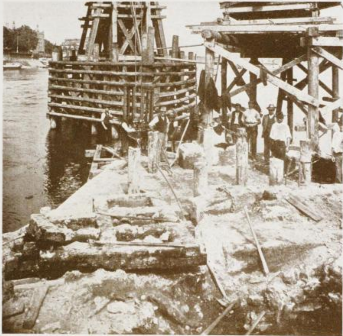
81. Koff der Hinterkopfes von Pfeiler 12.