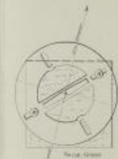
Station 4. Jeschken