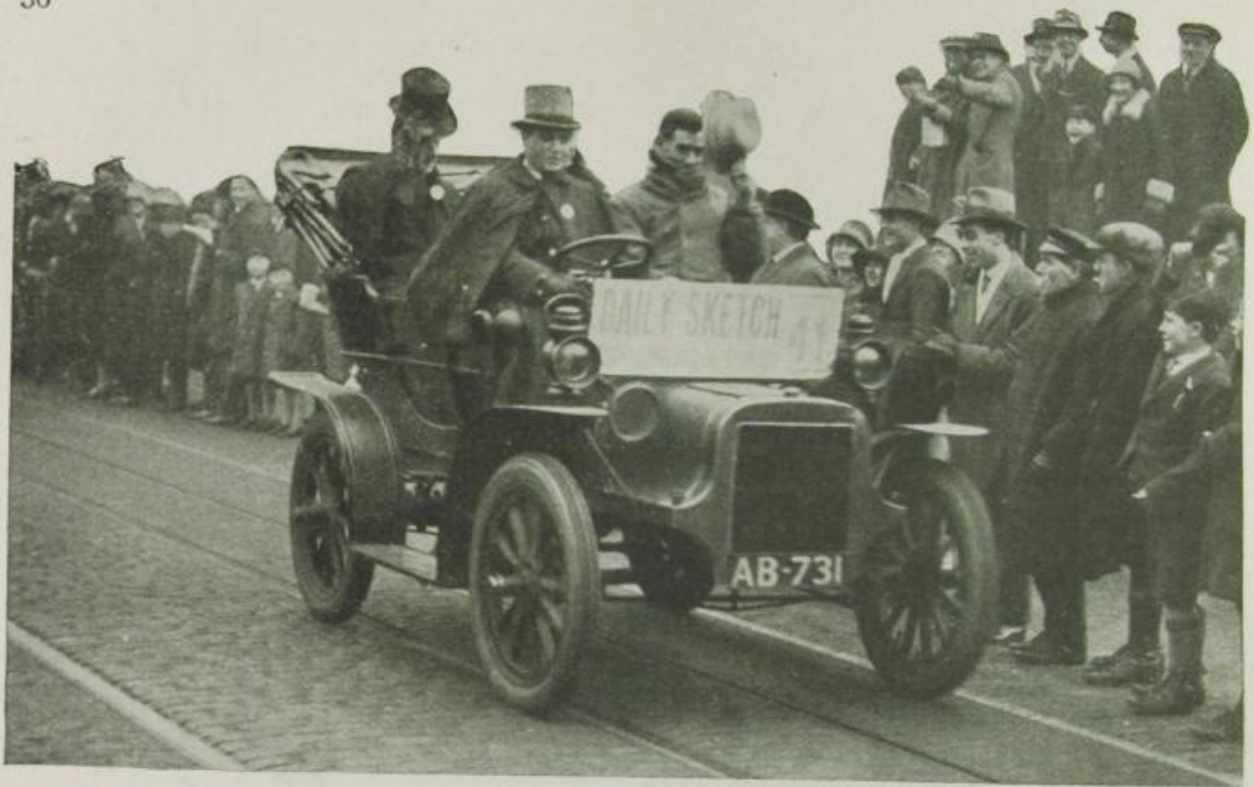
Der Sieger auf der Strecke in voller Fahrt

Das obere Bild zeigt einen Adlerwagen. Kann man es sich vorstellen, daß unsere Großväter und Väter in solchen Autos zu reisen pflegten? Eine Geschwindigkeit von ungefähr 40 Stundenkilometern war für damalige Verhältnisse eine respektable Leistung, ja beinahe ein Rekord!