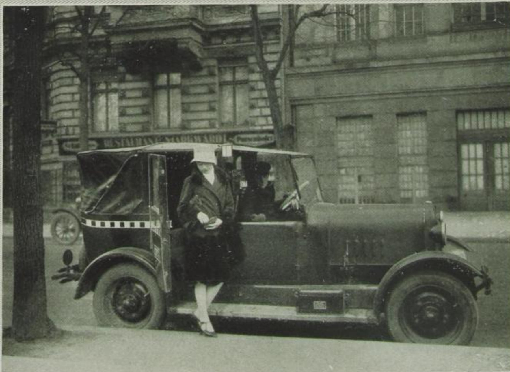
Es reicht gerade noch zum „Einstreifer“