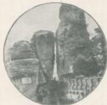
Rastebücke n. Radeburg