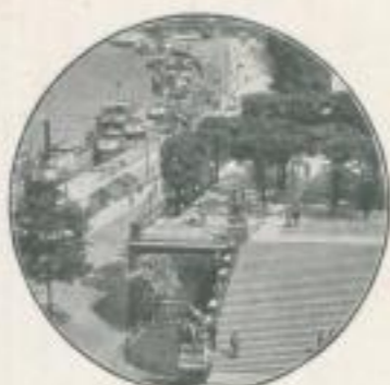
Dresden (Brühl'sche Terrasse)