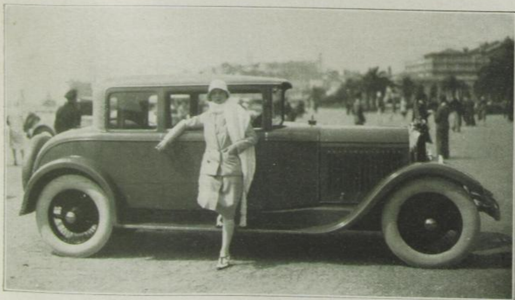
Mme. Malleret vor ihrem nilgrünen Voisin

In den Höfen der großen Rivierahotels rüstet man bereits die großen Reise- wagen zur Abfahrt nach den traditionellen Erholungsstätten — Sevilla, Montreux, Florenz, Biarritz. Ehe sich das fashionable Volk in alle Winde zerstreut, hat die Stadt Cannes noch einmal zu einer Konkurrenz eleganter Autos eingeladen, und die 200 schönsten Luxuswagen des Luxuslandes zwischen Mentone und St. Raphael auf der Croisette zu diesem imposanten Defilee vereinigt. Es gibt wenig Orte, die einer mondänen Freilichtveranstaltung einen eleganteren Rahmen