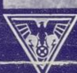
Mit dem „Adler Standard 6“ ins Freie und gemensendieckt, eines der schönsten Sommervergnügen. Vielleicht ist es auch die Freude über den „Adler Standard 6“ – den elegantesten und rassistesten Damenwagen, den man sich wünschen kann