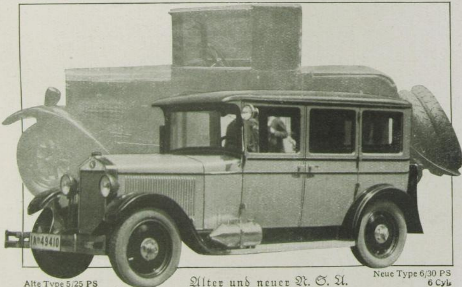
Alte Type 5/25 PS 4 Cyl.