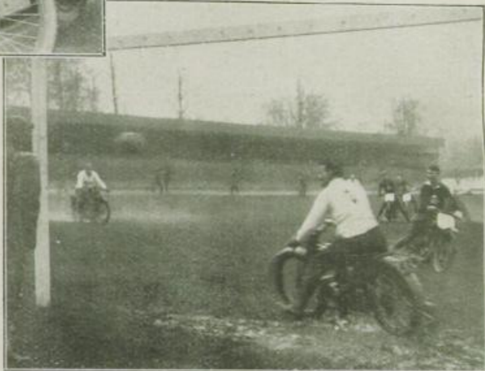
Fußballspiel auf dem Motorrad

Billige Anschaffung und Unterhaltung, einfache Unterbringung, leichte Transportfähigkeit bei gleicher Schnelligkeit, sind Eigenschaften, die das Knatterrad dem Publikum immer näher bringen.