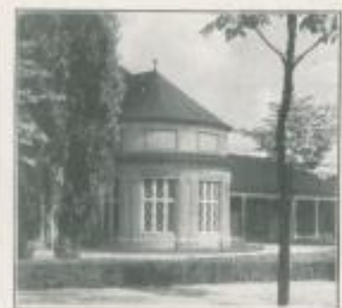
Bad Saarow, Moorbad