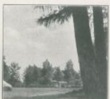
Bad Saarow, Platz am Stein