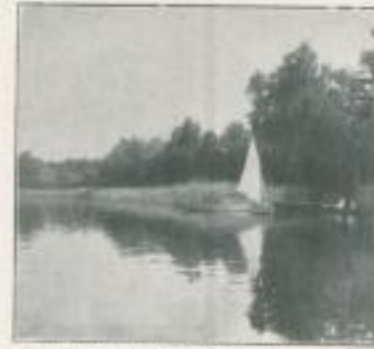
Storkow-M., Bucht b. Rest. Karlsint

Benutzt den Lotsendienst des A. D. A. C. Telefon: F 5 Bergmann 2316/17