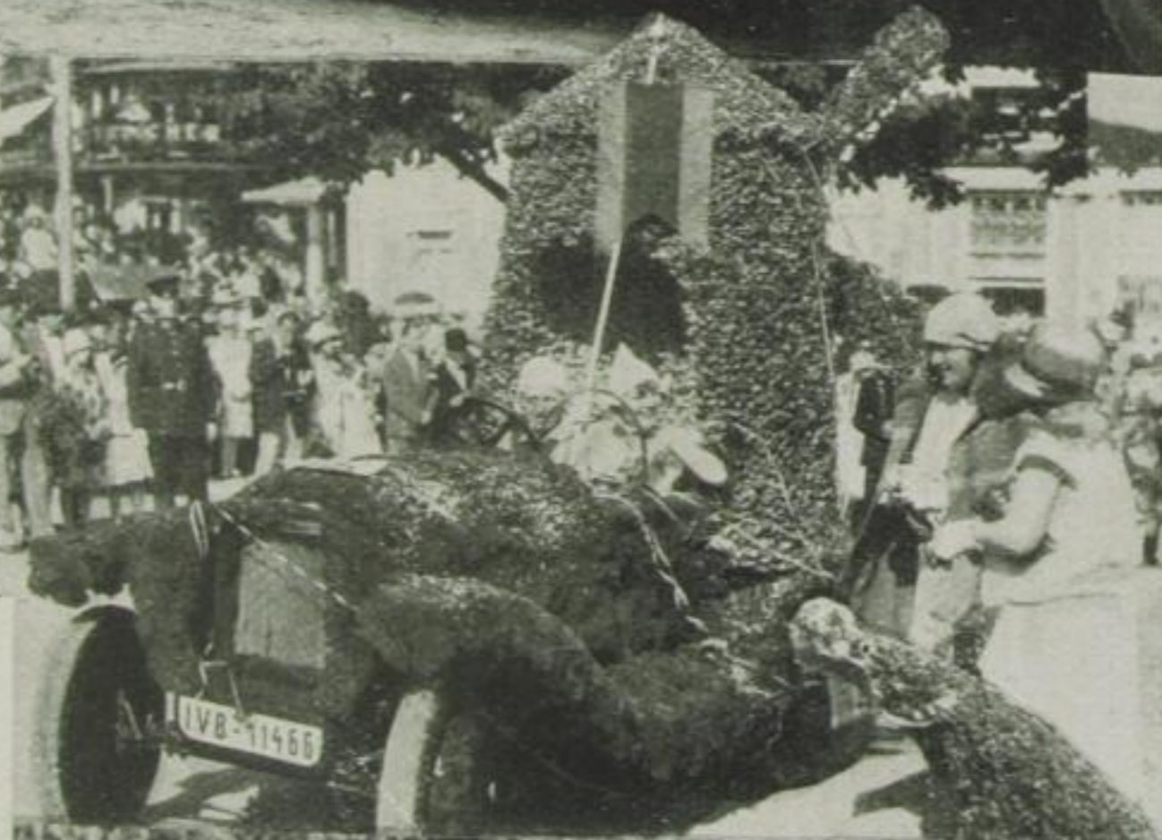
Mitte: Eine entzückende holländische Windmühle