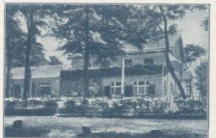
Das Schützenhaus in Biesenthal