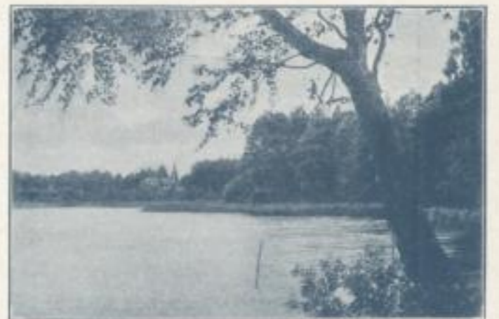
Biesenthal am Großen Wuckensee