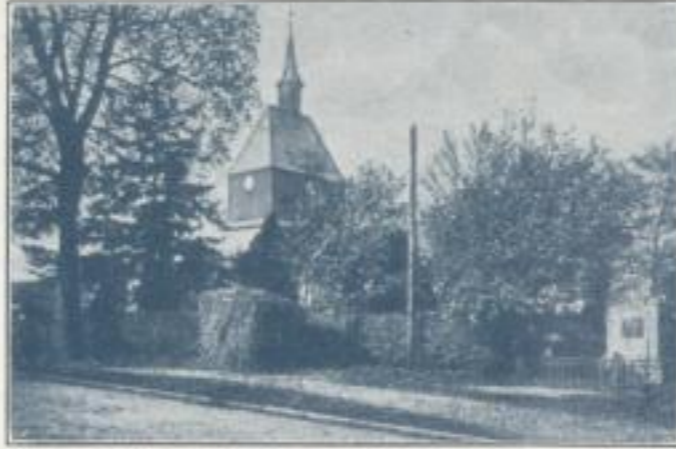
Wandlitz, Kirche und Denkmal