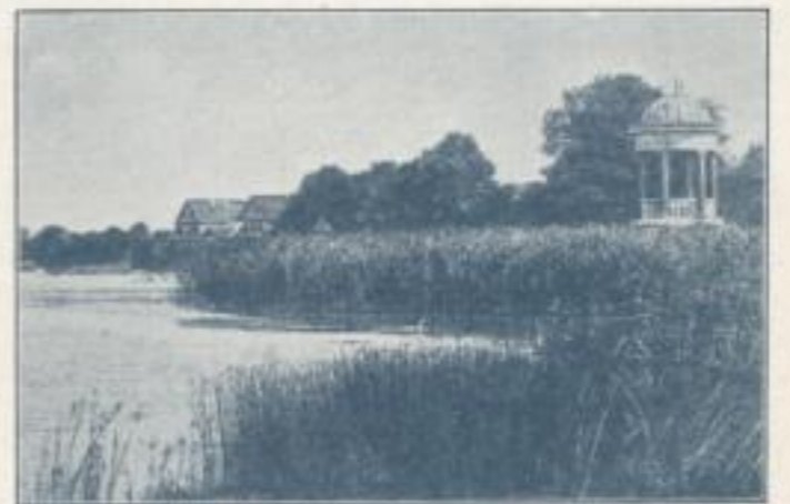
Schilfpartie am Wandlitzsee