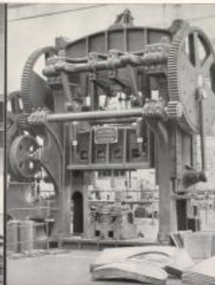
Die Hincapresse (28 t) zum Drücken von Karosserie-Blechteilen