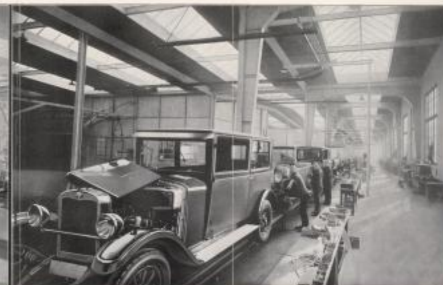
Das Ende der Hauptmontagearbeiten: Der Wagen ist fertiggestellt und fahrbereit