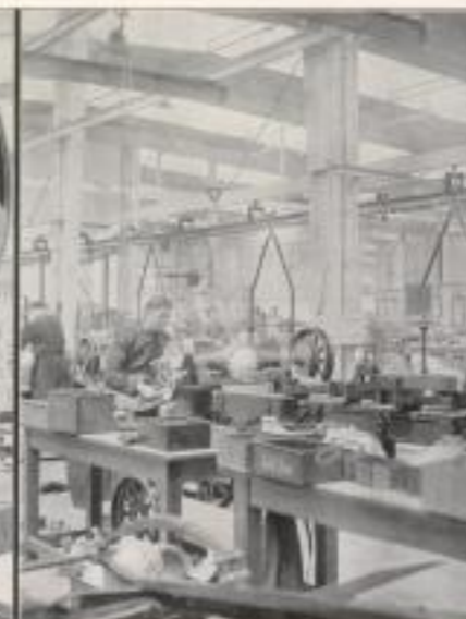
Montagebänke für Vorder- und Hinterrahmen