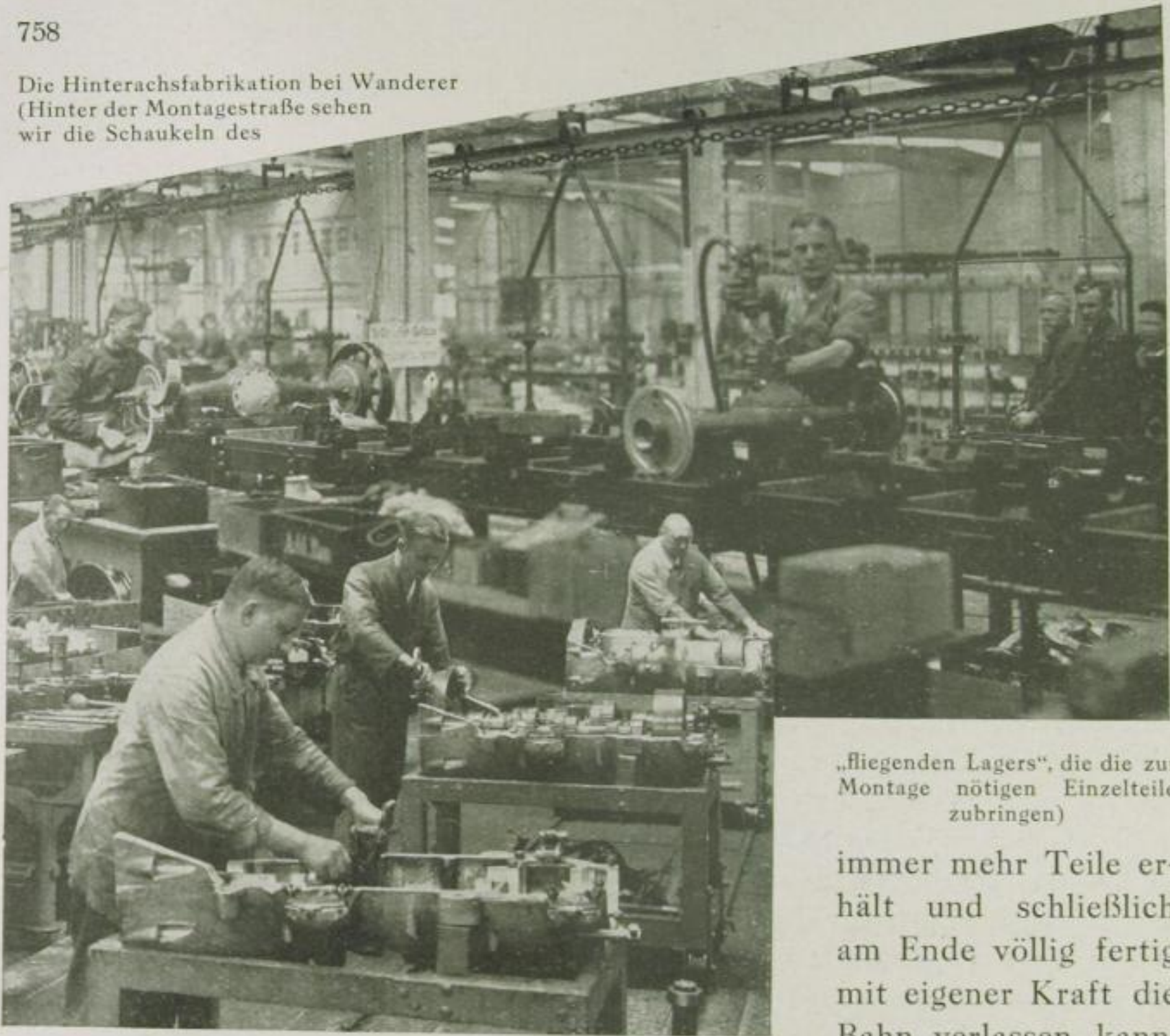
4. u. 5. Der Zusammenbau eines Getriebes (Aus der Lastwagenfabrikation der MAN)

Die Hinterachsfabrikation bei Wanderer (Hinter der Montagestraße sehen wir die Schaukeln des