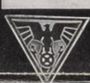
Anlässlich der Jubiläumsfeier des Moskauer Künstlerischen Theaters wurde dem verdienten Leiter desselben, Konstantin Stanislawsky diese wundervolle 15/70 PS „Adler Standard 8“ Limousine durch Max Reinhardt zum Geschenk gemacht