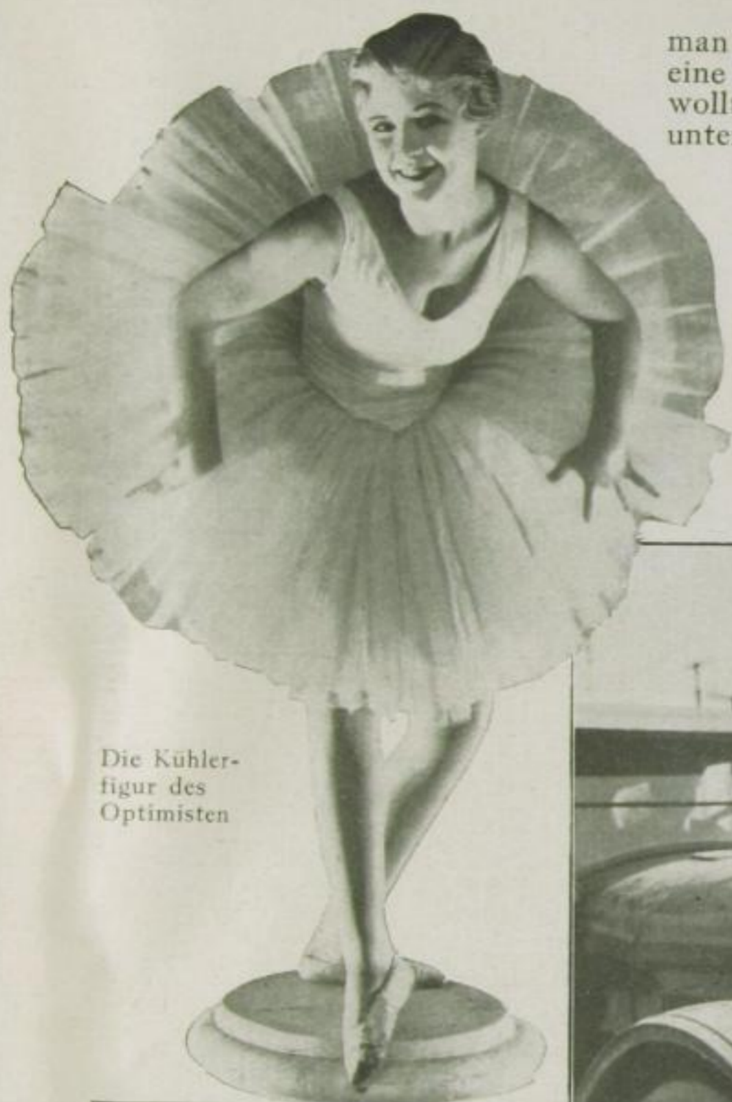
Die Kühler- figur des Optimisten