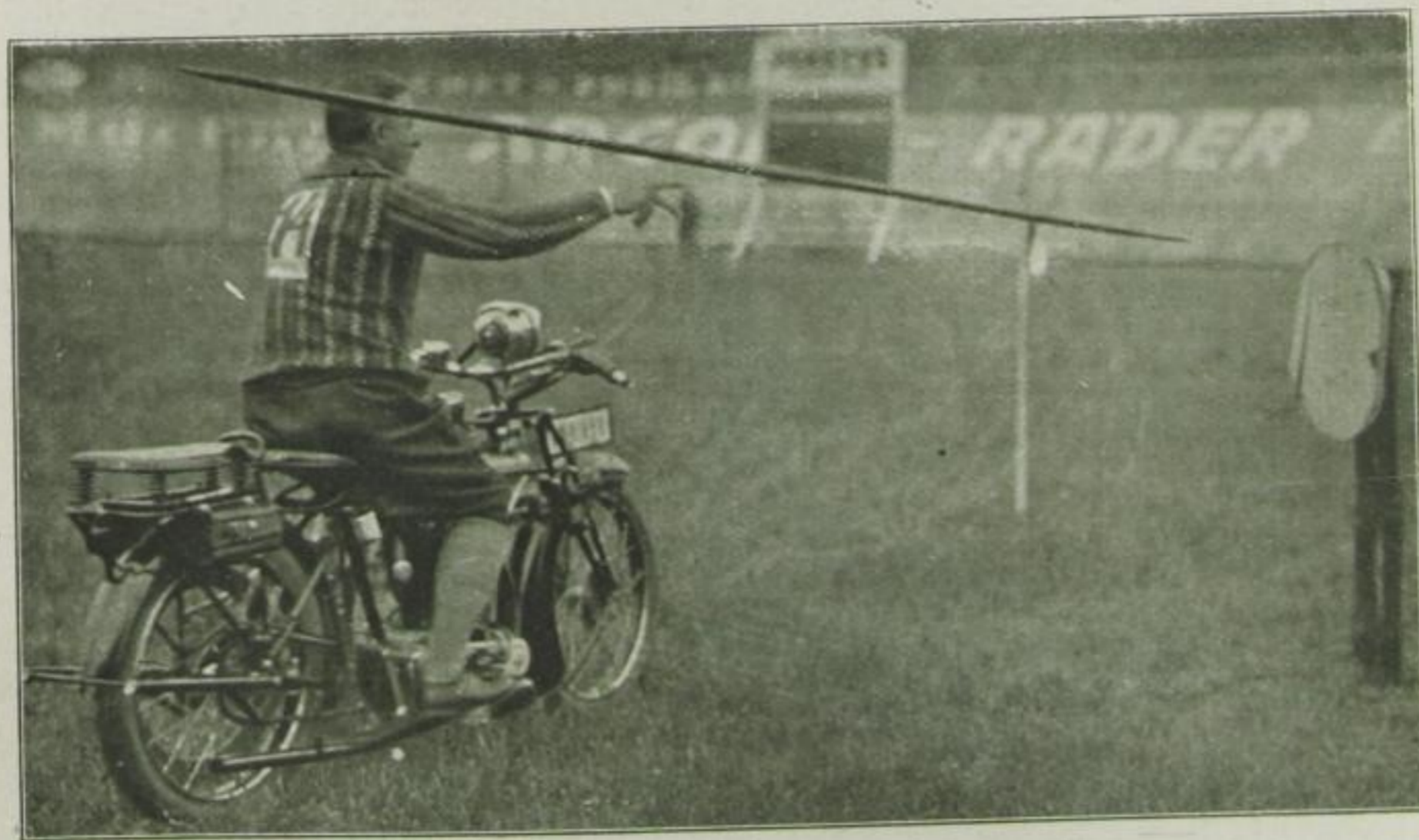
Speerwerfen in voller Fahrt