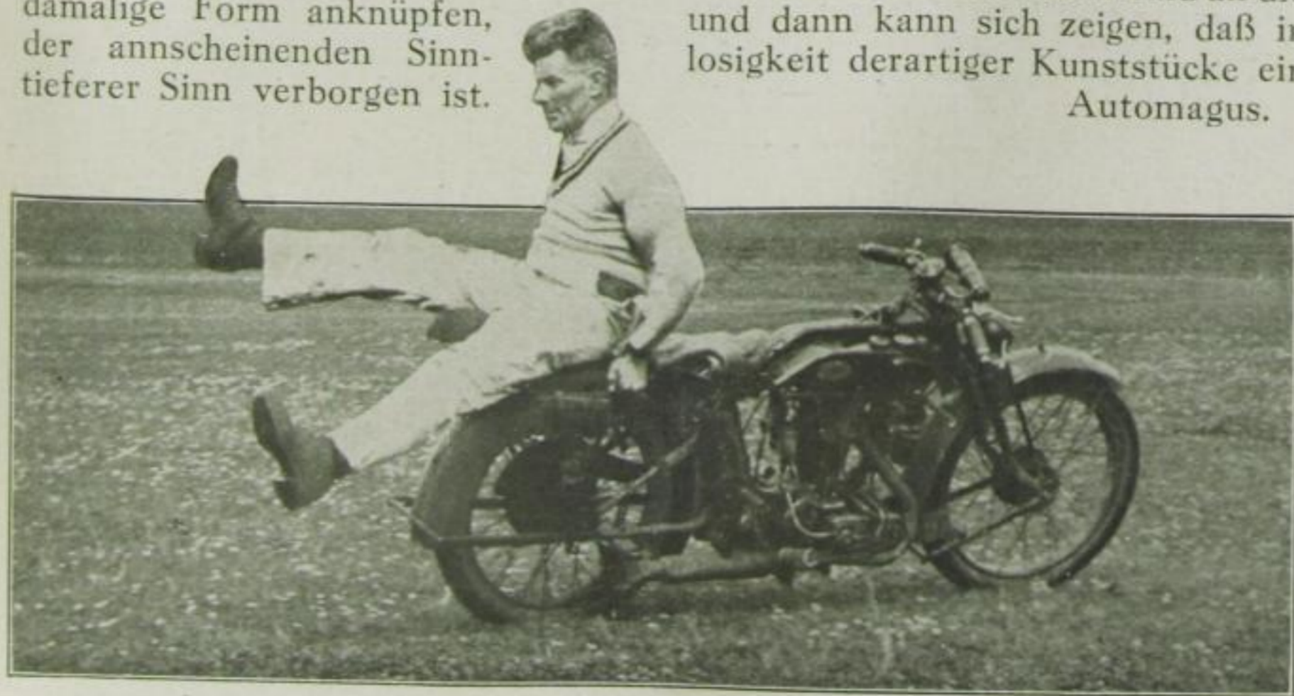
Volte auf fahrendem Motorrad

einmal und vielleicht sehr bald an die und dann kann sich zeigen, daß in losigkeit derartiger Kunststücke ein Automagus.