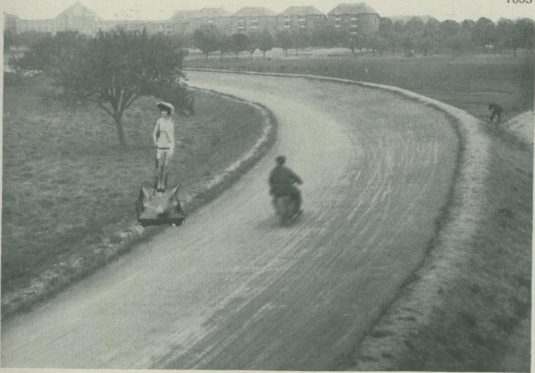
Statt des hölzernen Schutzmannes werden an besonders gefährlichen Kurven lebende Badegirls aufgestellt