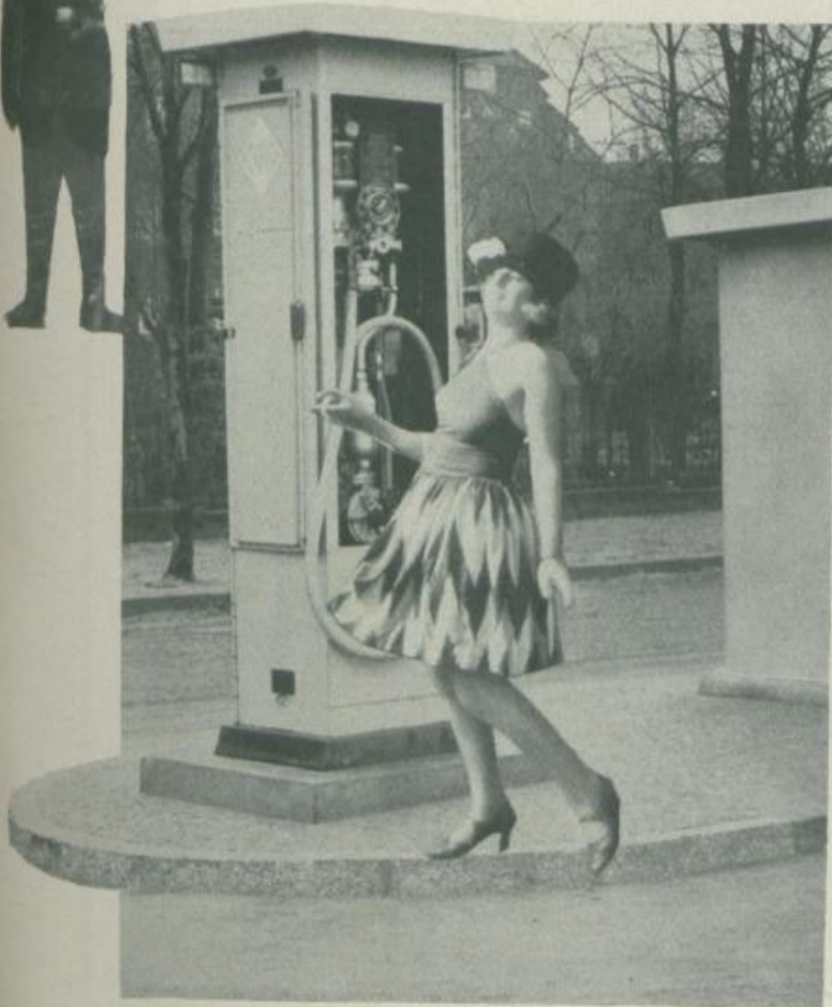
Eine Öl-Firma macht besonders gute Geschäfte (Kommentar überflüssig)