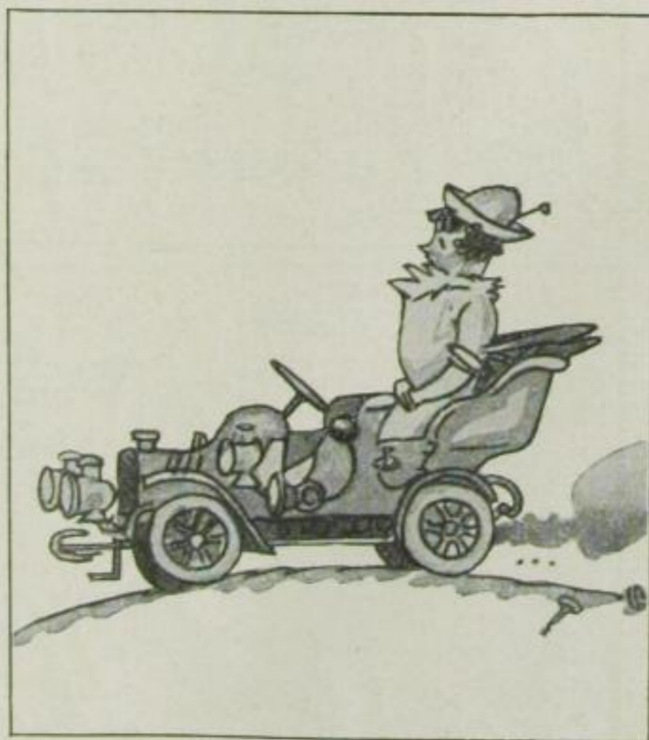
Die olle Mühle

„Soll ich Ihnen sagen, wie Sie nun weiter fahren?“