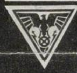
Der bekannte schwedische Filmschauspieler Max Henning fährt während seines Aufenthaltes in Deutschland nur den „Adler Standard 8“