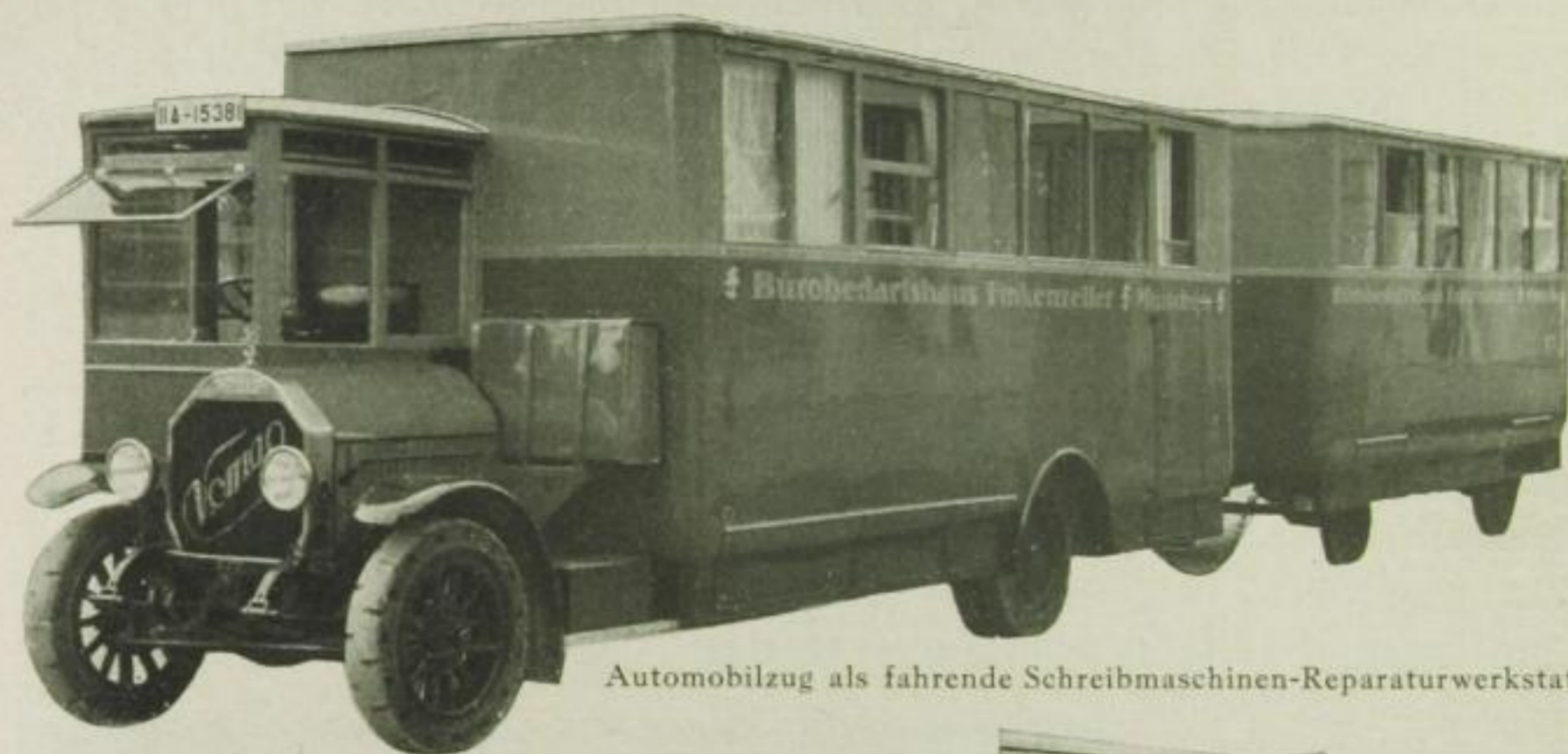
Automobilzug als fahrende Schreibmaschinen-Reparaturwerkstatt

gerichteten Schreibmaschinen-Werkstätte gehört: Drehbank, Polierzelle, Emaillieraum, Vernickelungs- und Entstaubungsanlage, diese letztere von einer Leistungsfähigkeit, daß auch die verschmutztesten Maschinen bald sauber werden.