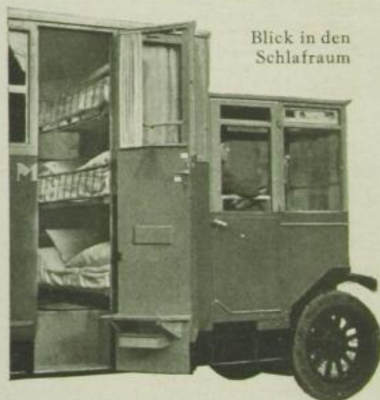
Blick in den Schlafräum

Alle zahlreichen und vielseitigen Arbeiten geschehen während der Wagen irgendwo hält oder auch während einer Rundfahrt. Das abgeholte Stück wird in kürzester Frist wieder zugestellt. Keine Zeit geht verloren. Besonders ausgebildete Mechaniker begleiten den Wagen, ja, sie schlafen sogar in ihm. Ebenso ein kaufmännischer Sachwalter, denn der zweite Wagen, der Anhänger, ist als Büro ausgestattet. Hier wird gleich der kaufmännische Teil der ganzen Angelegenheit erledigt.