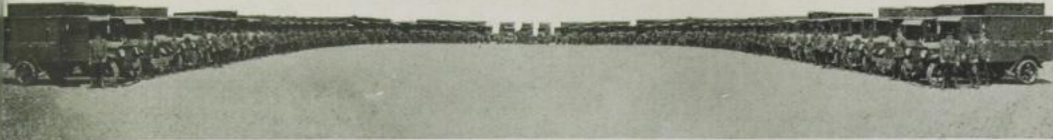
Panzerwagenpark des New Yorker Bankvereins