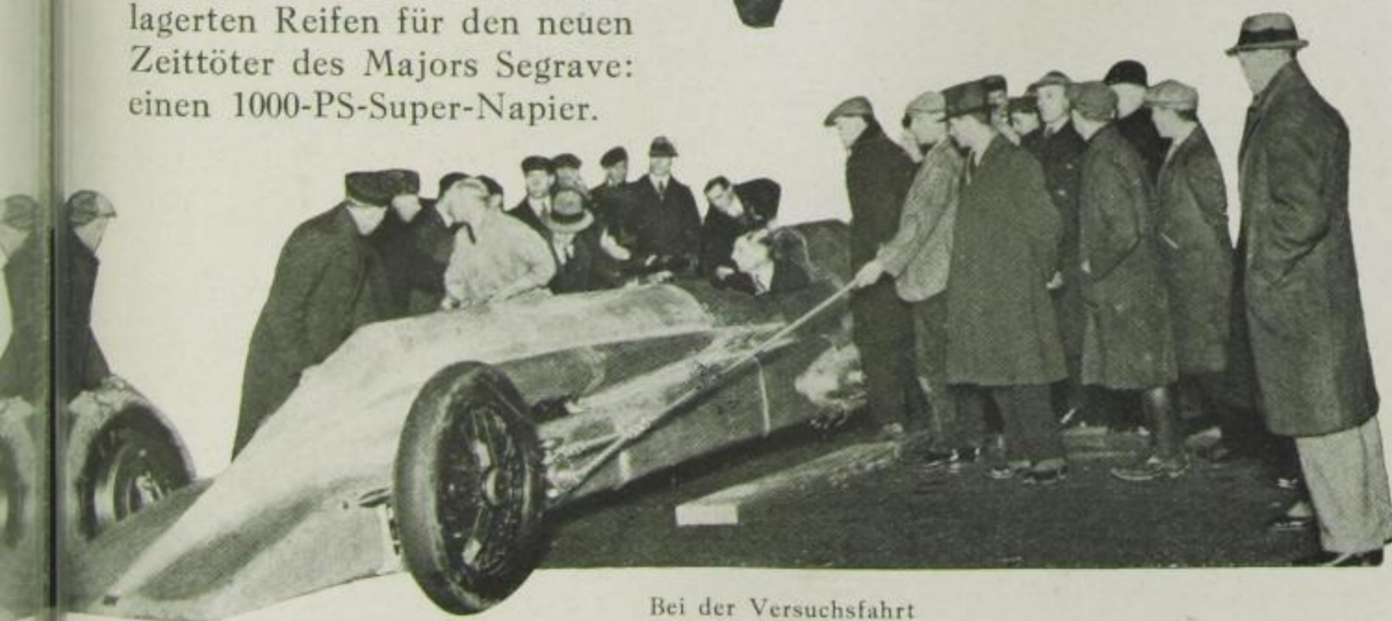
Bei der Versuchsfahrt

Es ist eigenartig genug, daß Major Segrave denselben durch Leutnant Websters Sieg im Schneider-Pokal weltbekannt gewordenen Napier-Motor „Racing Lion“ zum Einbau in seinen „Goldenen Pfeil“ wählte, mit der der „Blaue Vogel“ seines Rivalen Campbell ausgerüstet war.