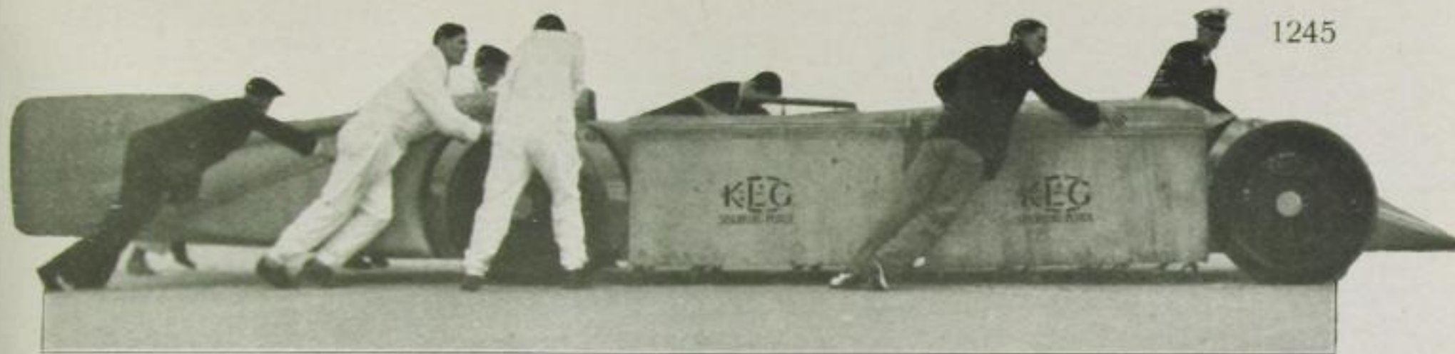
Der „Sieger“ — der Goldene Pfeil (Major Segrave)

Schleudern kommen zu lassen, hat sich Segrave eine neuartige Steuervorrichtung erdacht. Er hat vor dem Führersitz ein Zielfernrohr montieren lassen, wie es im Kriege vielfach bei Kampfflugzeugen gebräuchlich war. Da vom Wagen aus bei 350 Std./km natürlich keine Markierungen wahrnehmbar sind, hat man am Ziele eine riesige erleuchtete Scheibe angebracht, auf die Segrave sein Fernrohr richten wird. Es ist selbstverständlich, daß auch nur die geringste Abweichung von der eingeschlagenen Fahrtrichtung unmittelbare Gefahr für das Leben des Fahrers bedeutet. Wir 60-km-Fahrer bekommen erst den richtigen Begriff von den ungeheuren Energiemengen, die in dem schmalen geschmeidigen Körper des Segravschen Rennwagens gefangen sind, wenn wir bedenken, daß der erste der drei Gänge auf etwa 120 km, der zweite schon auf 250 und der dritte Gang gar auf 400 km abgestimmt ist.