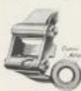
Der neue Brennabor-Sixer

Das Auto ist ein Meisterwerk der Technik, das die Vorteile eines Sechszylinders mit der Flexibilität eines Kleinwagens verbindet.