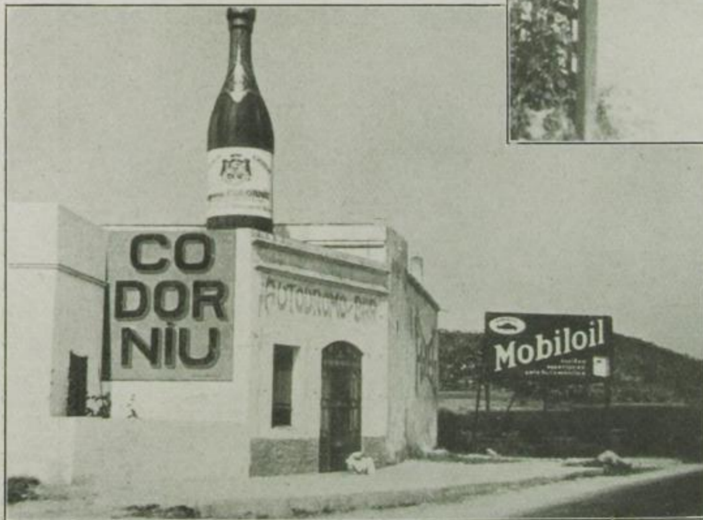
Tankstelle Madrid mit maurischem Pavillon

Mitte: Mammutreklame einer spanischen Sektfabrik gegenüber der großen Autorennbahn in Sitges