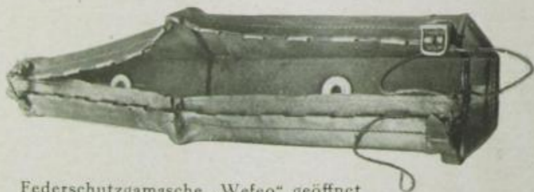
Federschutzgamasche „Wefeo“ geöffnet

fessoren Kluge und Wawrziniok empfehlen allgemein Federschutzgamaschen als wichtiges Hilfsmittel der Wagenpflege. Etwas hindernd wirkt noch der hohe Preis für die Garnitur eines Wagens, der viele Kraftfahrer heute noch abhält, dieses Schutzmittel, das direkt oder indirekt vor Autounfällen schützt, anzubringen. Preisverteuernd ist auch die Viel-