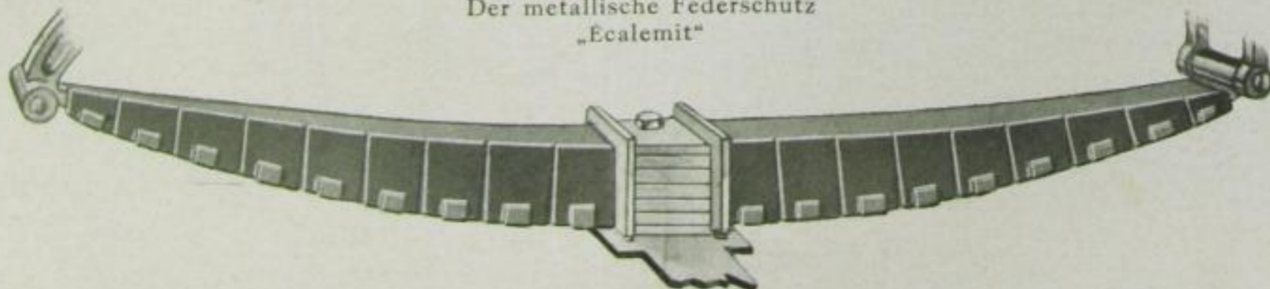
Der metallische Federschutz „Ecalemit“

heit der Federn, die die Hersteller zwingt, ein großes Lager zu halten, und doch noch häufige Sonderherstellungen vorzunehmen. Es sollen jedoch bereits einige Autofabriken gleiche Federgrößen an ihren Wagen anbringen. Vielleicht bringt auch erst die Zukunft die Lösung eines billigen und gleichzeitig guten Federschutzes.