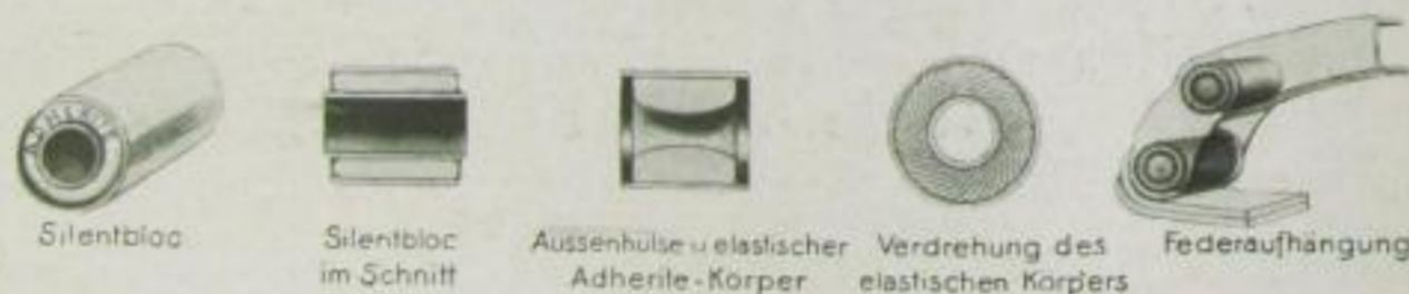
Aufbau des schmier- und reibungslosen Gummlagers „Silentbloc“, ganz rechts: Einbau in ein Federgehänge

Schmierung ist ebenfalls nicht notwendig, und das lästige Quietschen schlecht geschmierter Lager fällt ebenfalls fort. Für solche Gelenke gibt es eine große Zahl Anwendungsmöglichkeiten am Kraftwagen, z. B. Auf-