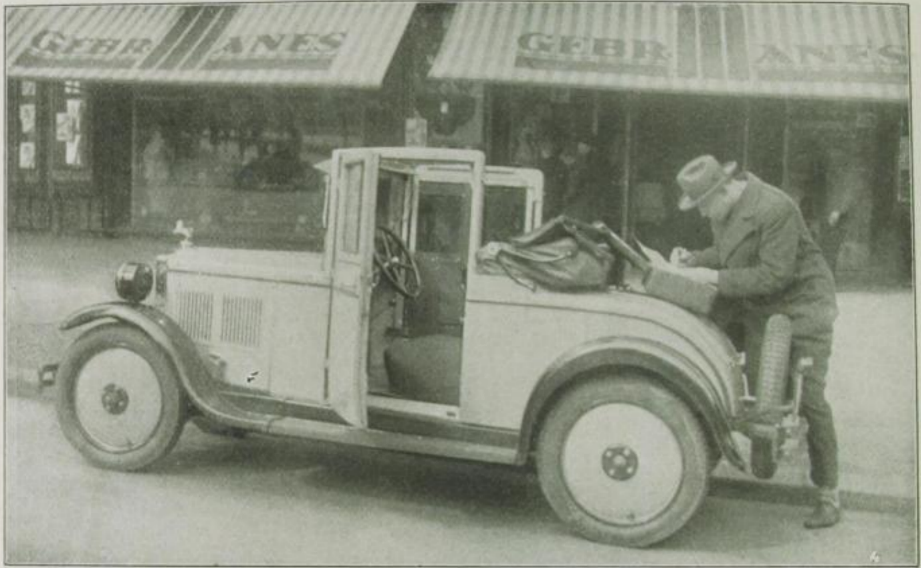
Wagen des Reisenden

Kraftfahrer. Er konnte sich ein Auto „bar“ leisten. Trotz der Nutzwertung ist sein Wagen schnittig und gut gebaut. Wenn er Sonntags seine Familie ladet, die vergnügt im blitzsauberen Wagen sitzt, ahnt kein Mensch, daß Hammelviertel und solide Doppelender das Vehikel je beschwerten. —