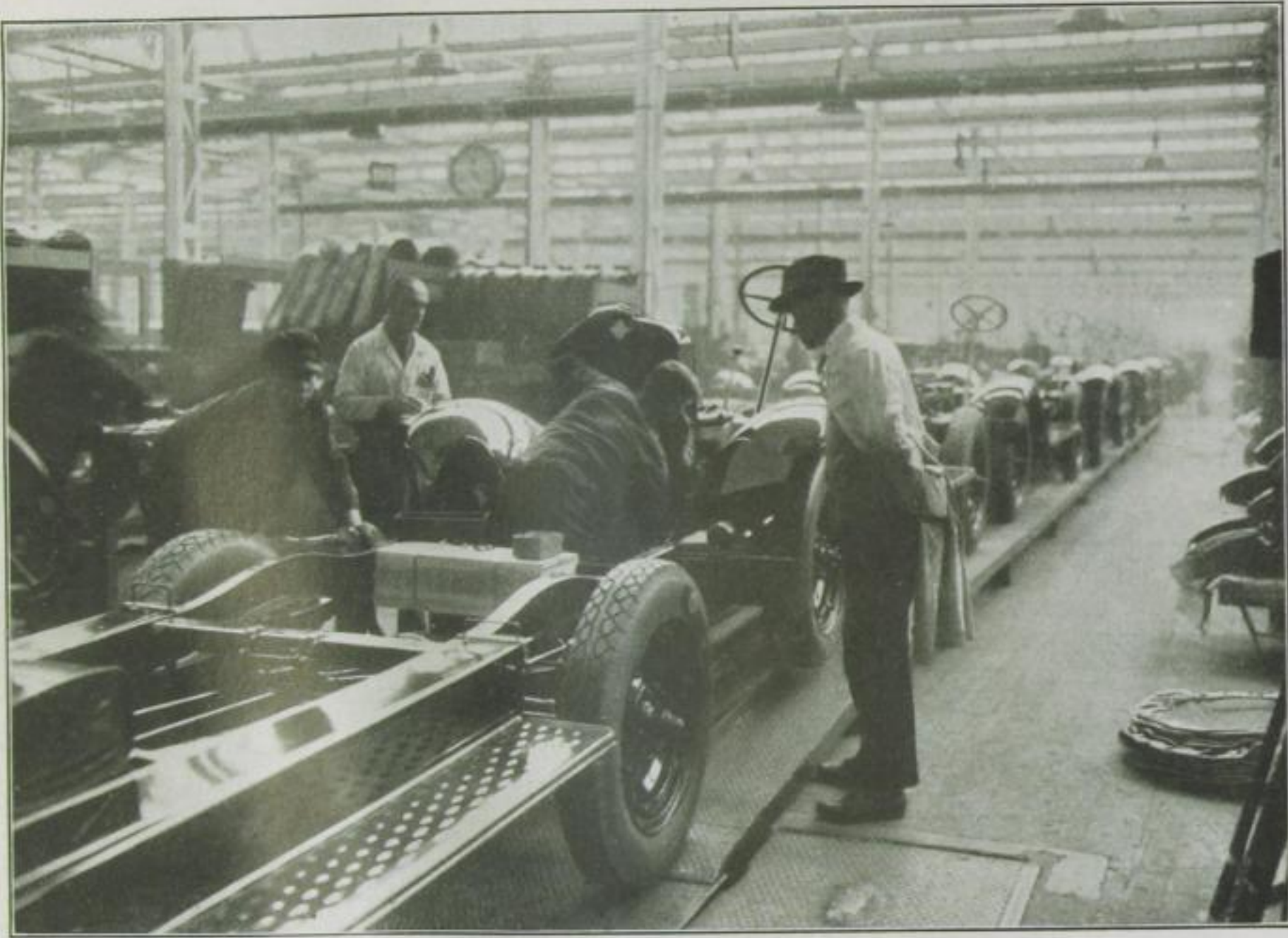
5. Aufsetzen der Kühlerhaube