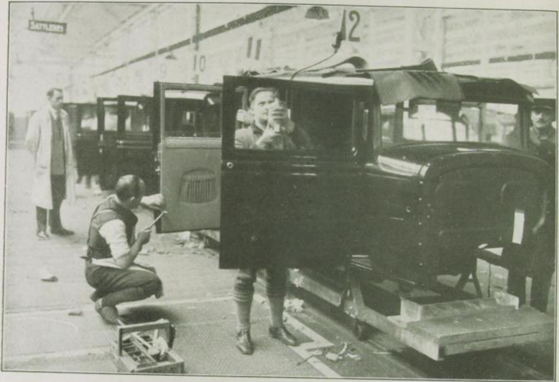
7. Anbringung der Polsterung