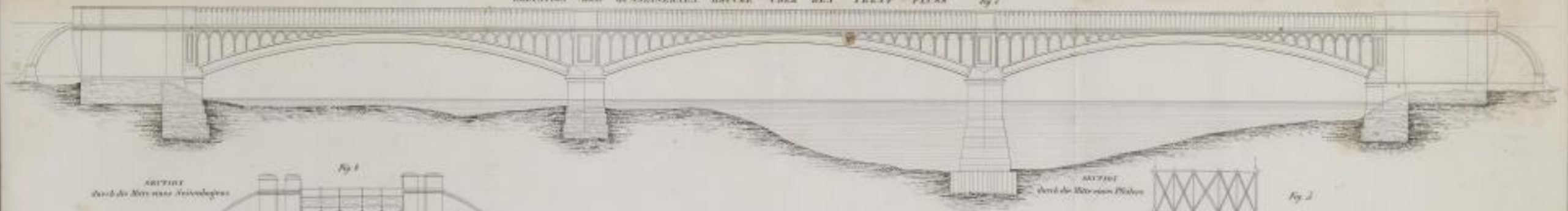
ANSICHT durch die Mitte eines Seitenbogens