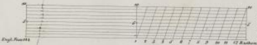
Fig. 3. 12 Bahnen