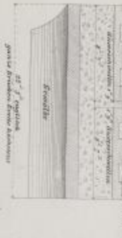
Fig. 5. Die Anordnungen der Eisenbahnen.

Die Anordnungen der Eisenbahnen. Die Anordnungen der Eisenbahnen. Die Anordnungen der Eisenbahnen.