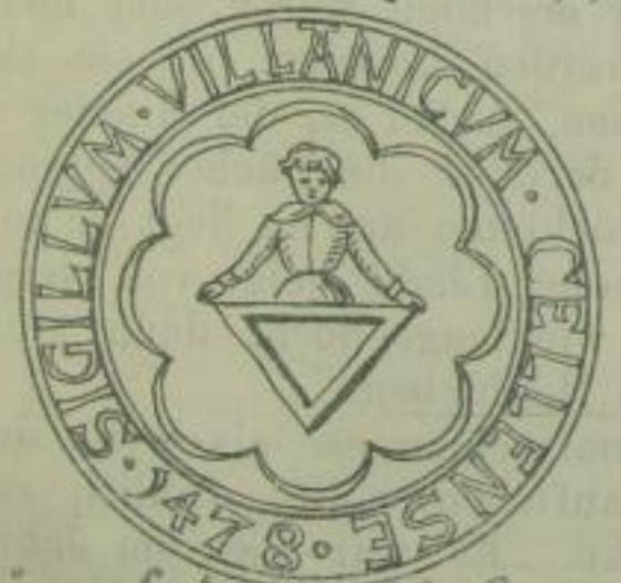
Siegel des Hofmeisters vom Kloster Zella. 1478.