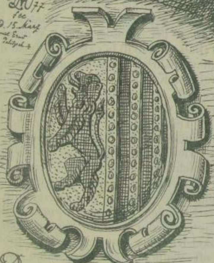
Dresdner Stadtwappen über dem Thore 1590.

18. 10. 77 100 2. 15. kurz mit Ernst Pöhlke