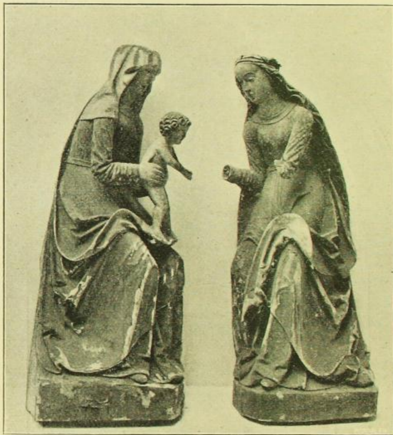
Fig. 87. Knobelsdorf. Heil. Selbdritt.

Tau'be, als Sinnbild des heiligen Geistes, von Holz, 33 cm breit, 21 cm