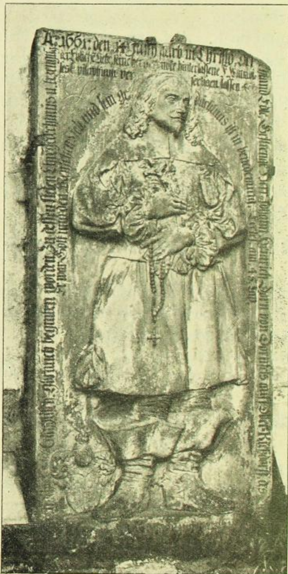
Fig. 127. Ostritz, Denkmal des Johann Heinrich Dorn von Dornfels.