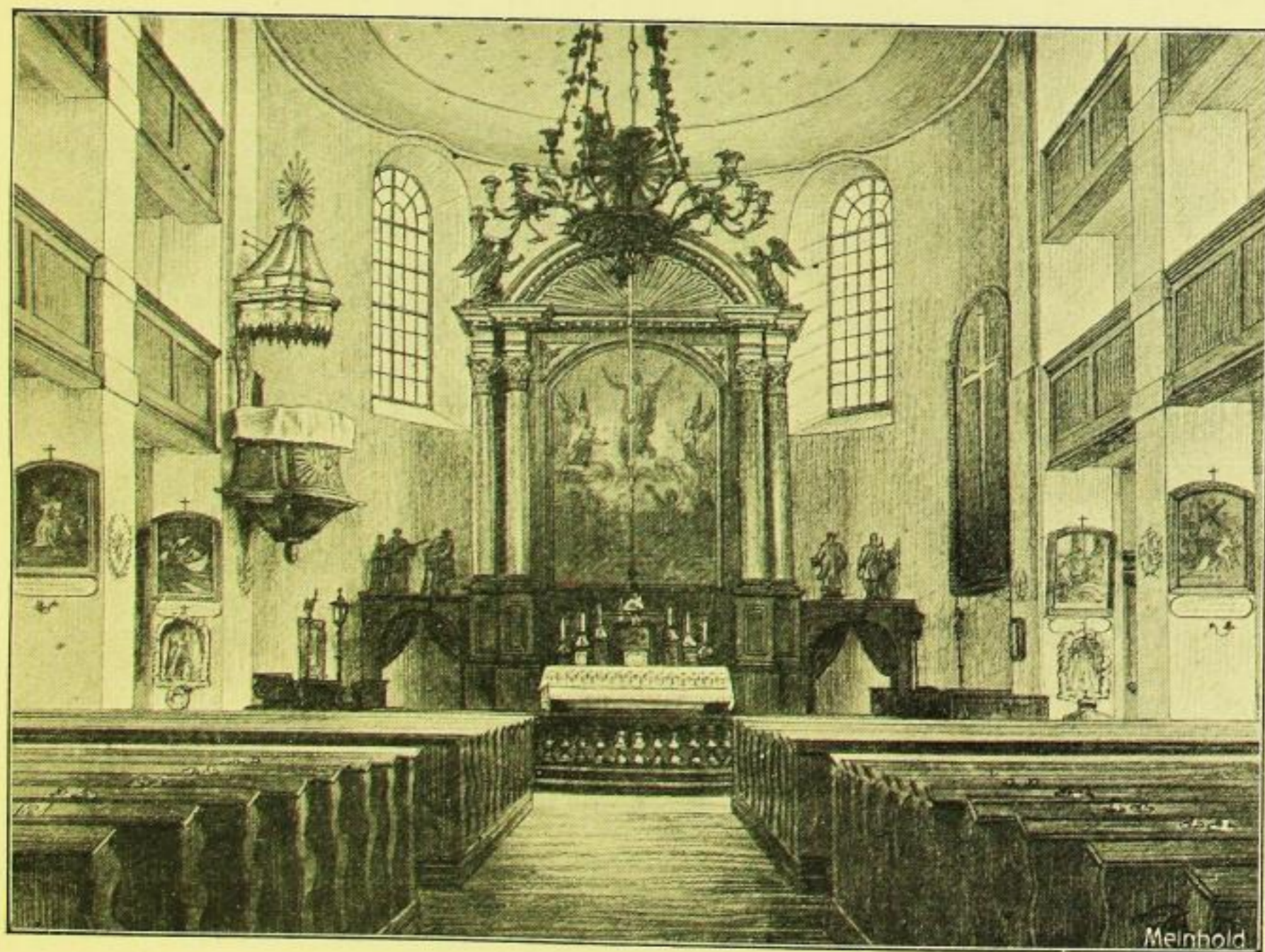
Fig. 11. Crostwitz, Kirche, Inneres. Vor dem Umbau von 1899; nach einer Photographie.

Das Innere wurde durch Abbruch der Holzemporen und Einbau von Steinfeilern und Gewölben 1898—99 gänzlich verändert (Fig. 11).