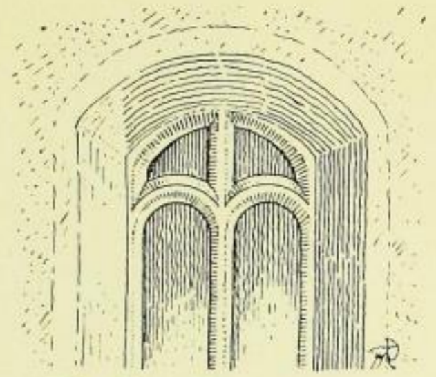
Fig. 81. Königsbrück, Hauptkirche, Fenster.

Das erste Geschoß ist von Säulen eingefast mit einer barock ver-