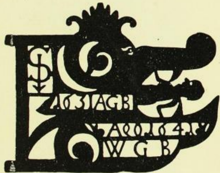
Fig. 85. Königsbrück, Hauptkirche, Wetterfahne.