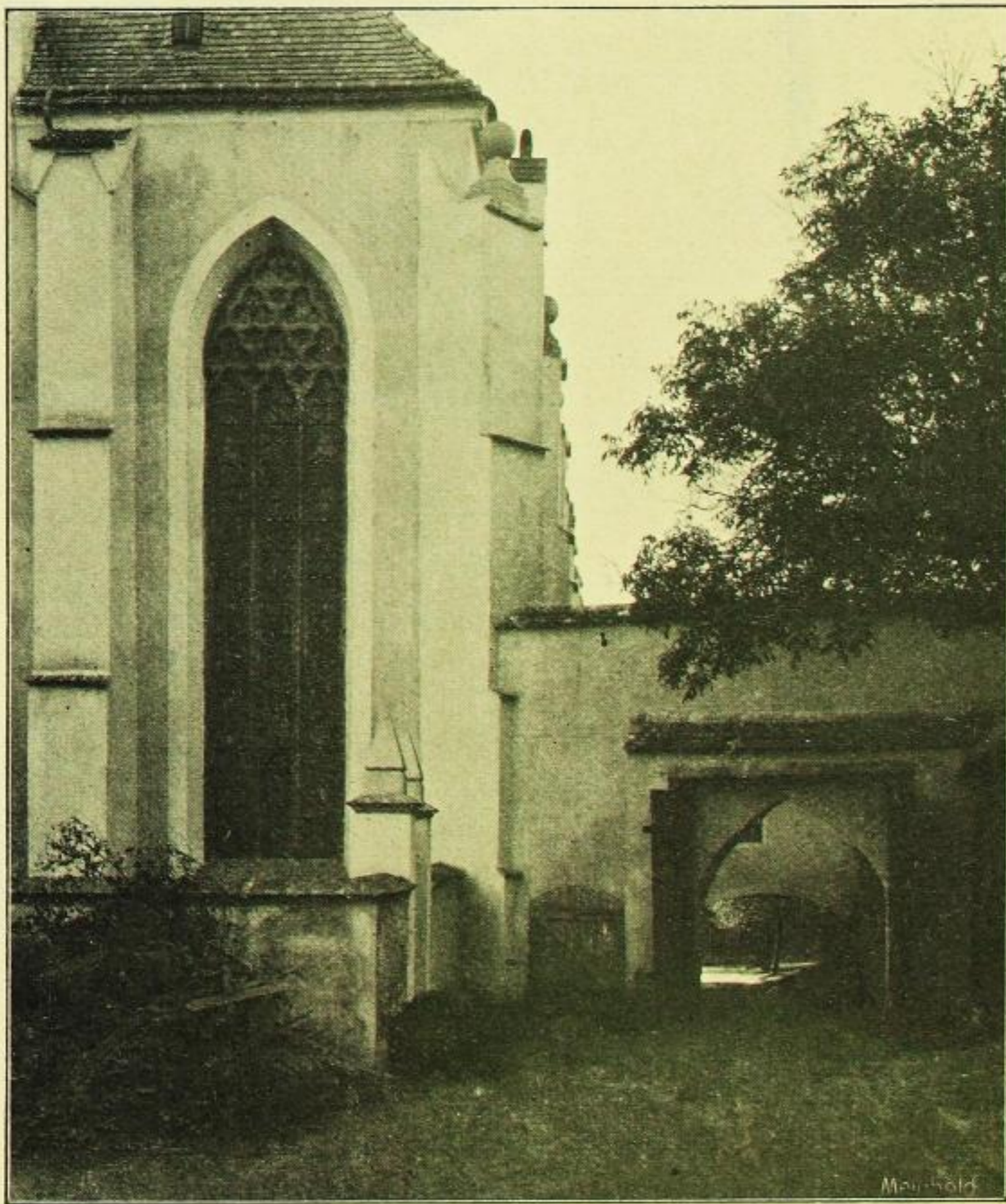
Fig. 156. Marienstern, Klosterkirche, Ostfenster des Nordschiffs.

Das Maßwerk der Fenster wechselt auf der Nord- und Südseite zwischen rund- und spitzbogigen Dreipässen, einer Form, die ebenfalls