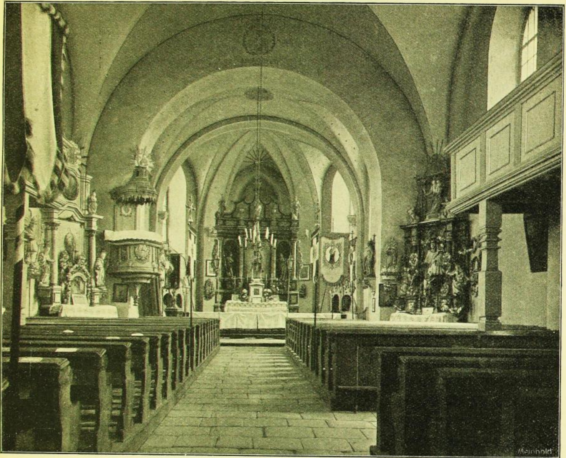
Fig. 305 Ralbitz, Kirche, Zustand vor 1906.

Männer- und Frauengestalt, in der Mitte je eine Vase. Der Giebel war geschweift umrissen. Um 1752.