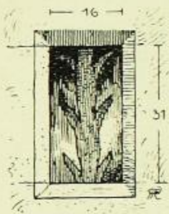
Fig. 326. Röhrsdorf, Herrenhaus, Kellerfenster.

Zehn unbezeichnete Bildnisse von Männern in der Tracht der Zeit um 1720, meist in Plattenrüstungen, eines darunter wohl einen jungen Fürsten darstellend, mit dem dänischen Elefantenorden an blauem Brustband, ein