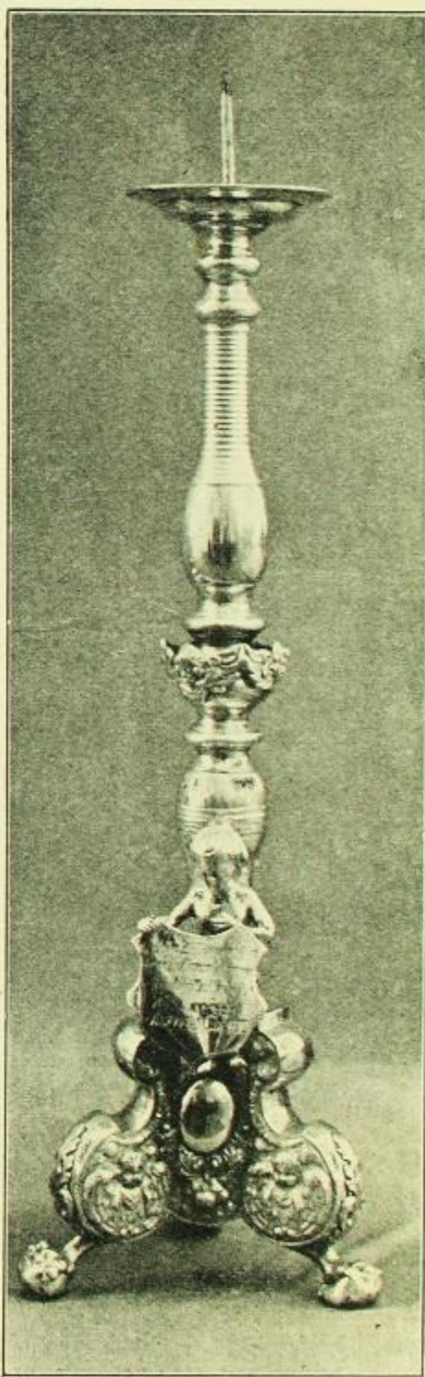
Fig. 98. Ebersbach, Kirche, Altarleuchter.

Diese Kanne / wurd zu einen / Gedächtniß / verehret in / die Kirche zu / Ebersbach von / Andrae(!)as Gochten.