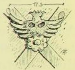
Fig. 443. Nostitz, Kirche, Beschlag.

richtete Kirche, die 1679 vollendet wurde. Durch Vergrößerung an der Westseite und teilweise Erneuerung im Jahre 1866 entstand der heutige Bau. — Die alte Kapelle war mit einem kleinen Turm versehen. Abbildungen oder Beschreibungen erhielten sich nicht.