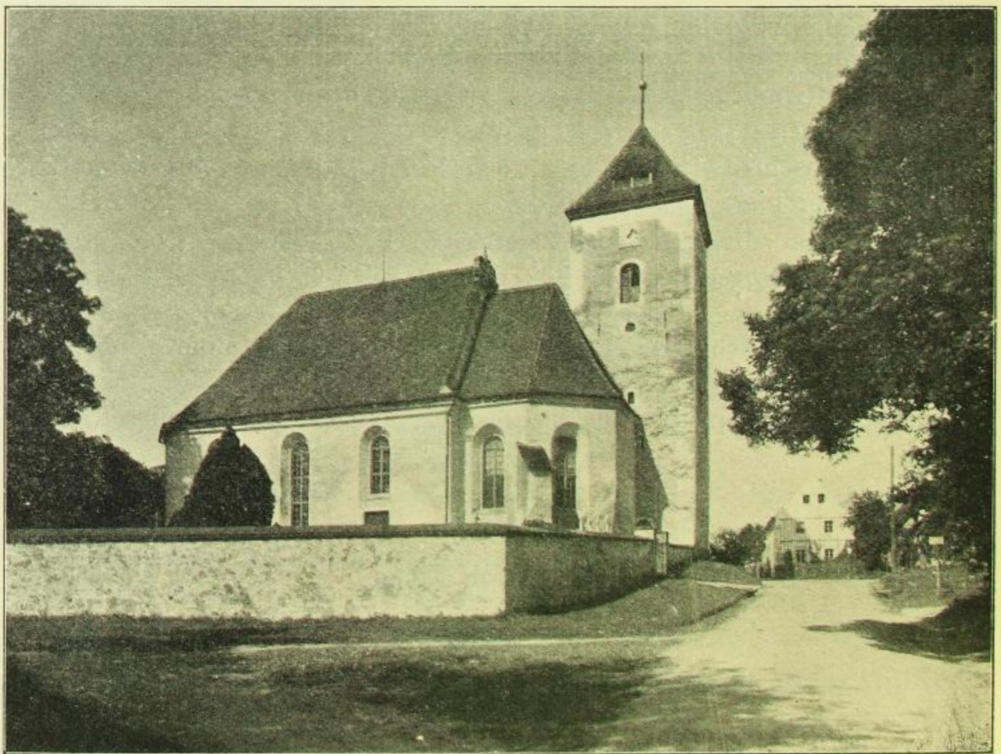
Fig. 444. Nostitz, Kirche, Ansicht von Süden.