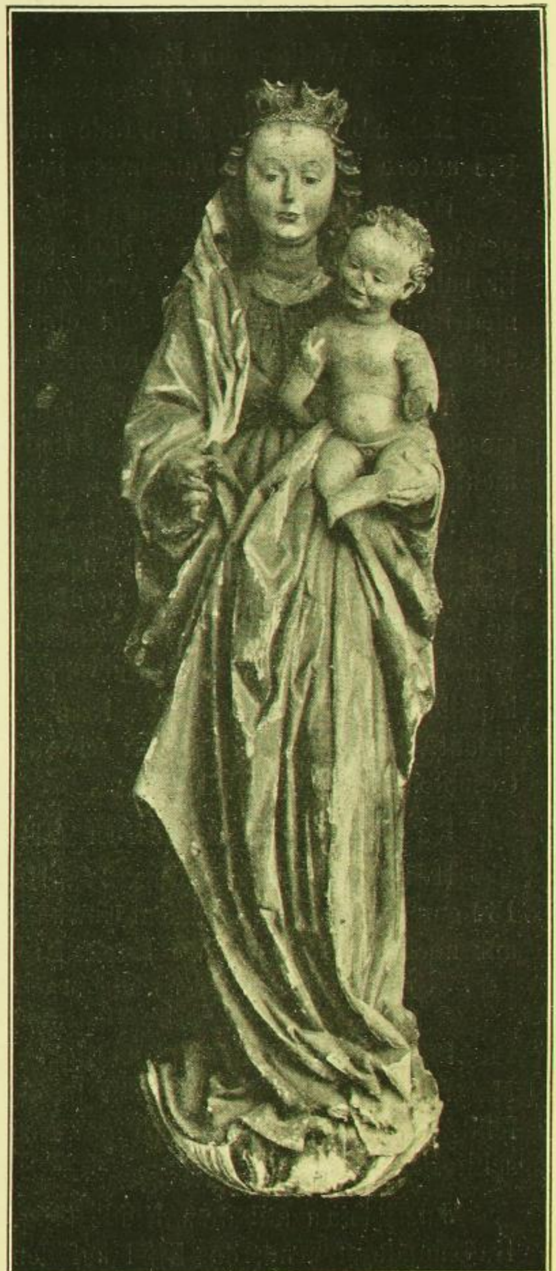
Fig. 23. Bischofswerda, Begräbniskirche, Jungfrau mit dem Kinde.

Oben und unten abgerundet, darüber in einem runden Lorbeerkranz zwei Wappen. In den Zwickeln zwischen Kranz und Platte je ein Engelsköpfchen, jetzt verstümmelt. Die Platte bez.: