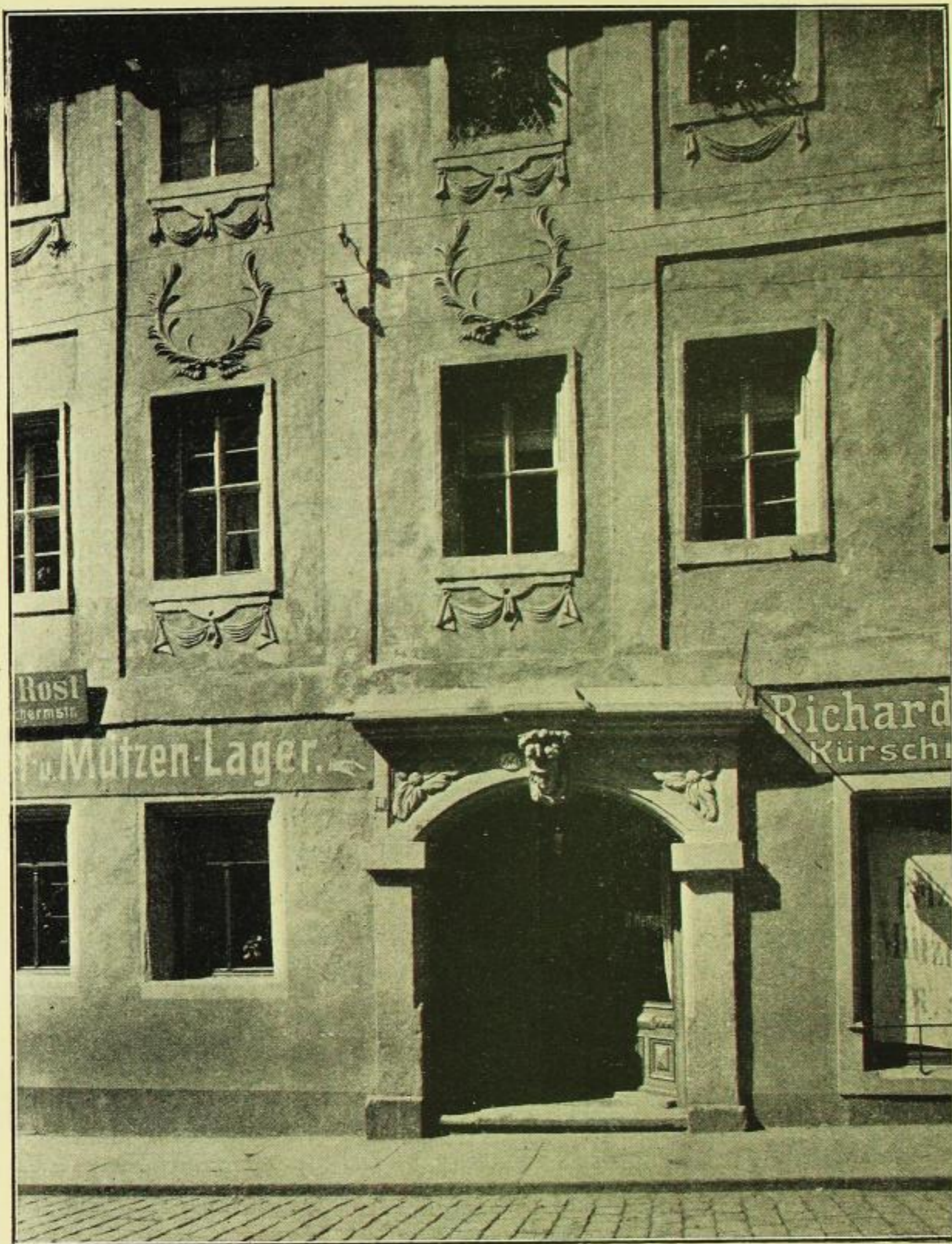
Fig. 337. Burgstraße Nr. 8, Vorderansicht.