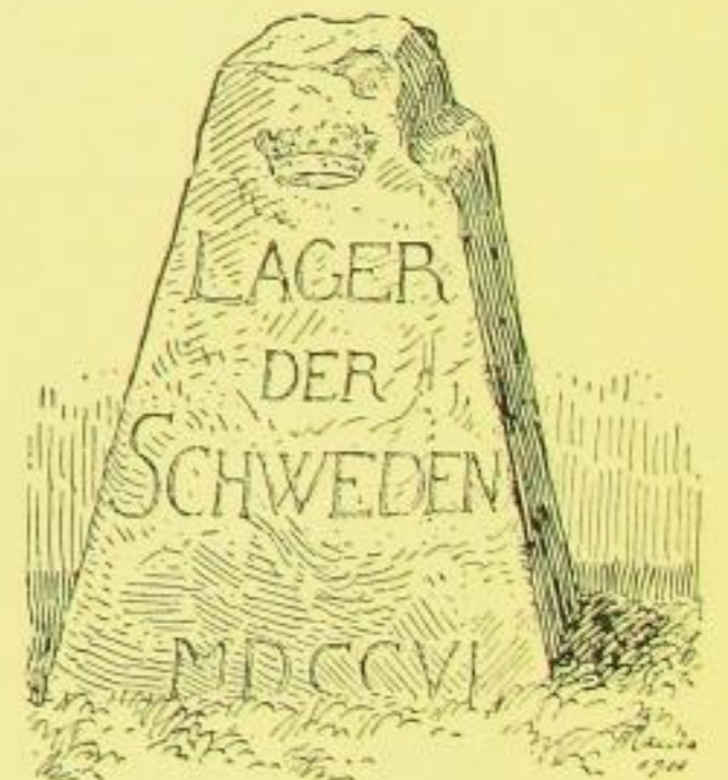
Fig. 156. - Kleinnaundorf, Denkstein.

Im Walde, rechts an der Radeburg-Kleinnaundorfer Straße, nördlich unweit des niederen Teiches, etwa 1\frac{1}{4} km vor dem Dorfe.